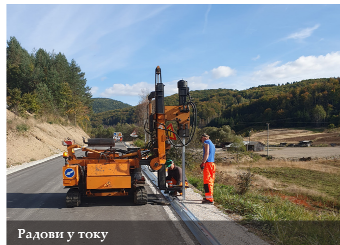
Радови у току