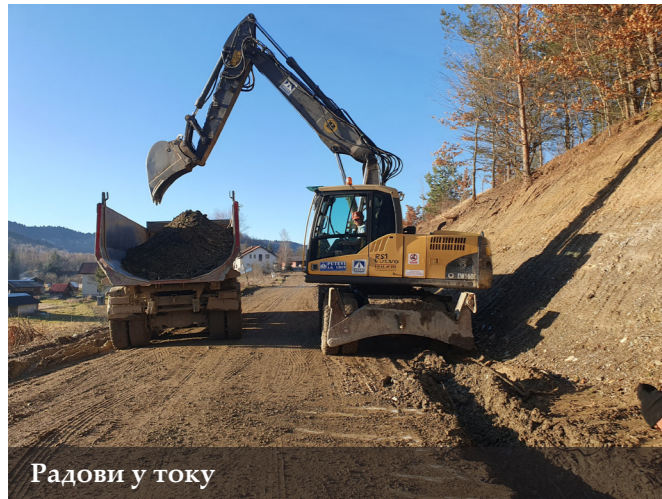
Радови у току