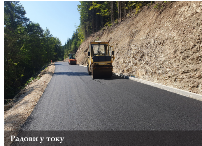
Радови у току