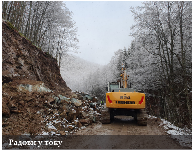
Радови у току