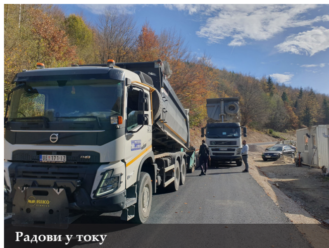
Радови у току