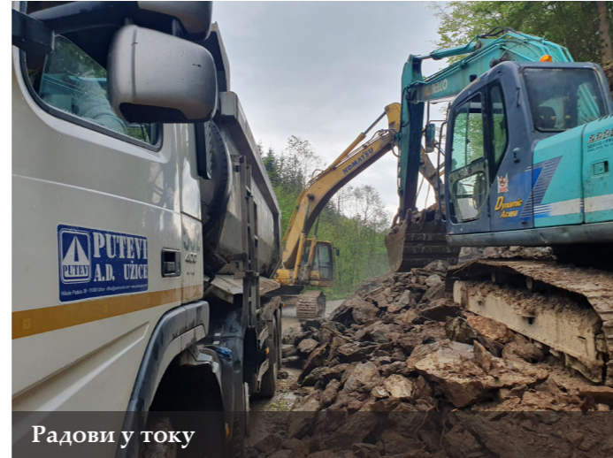
Радови у току