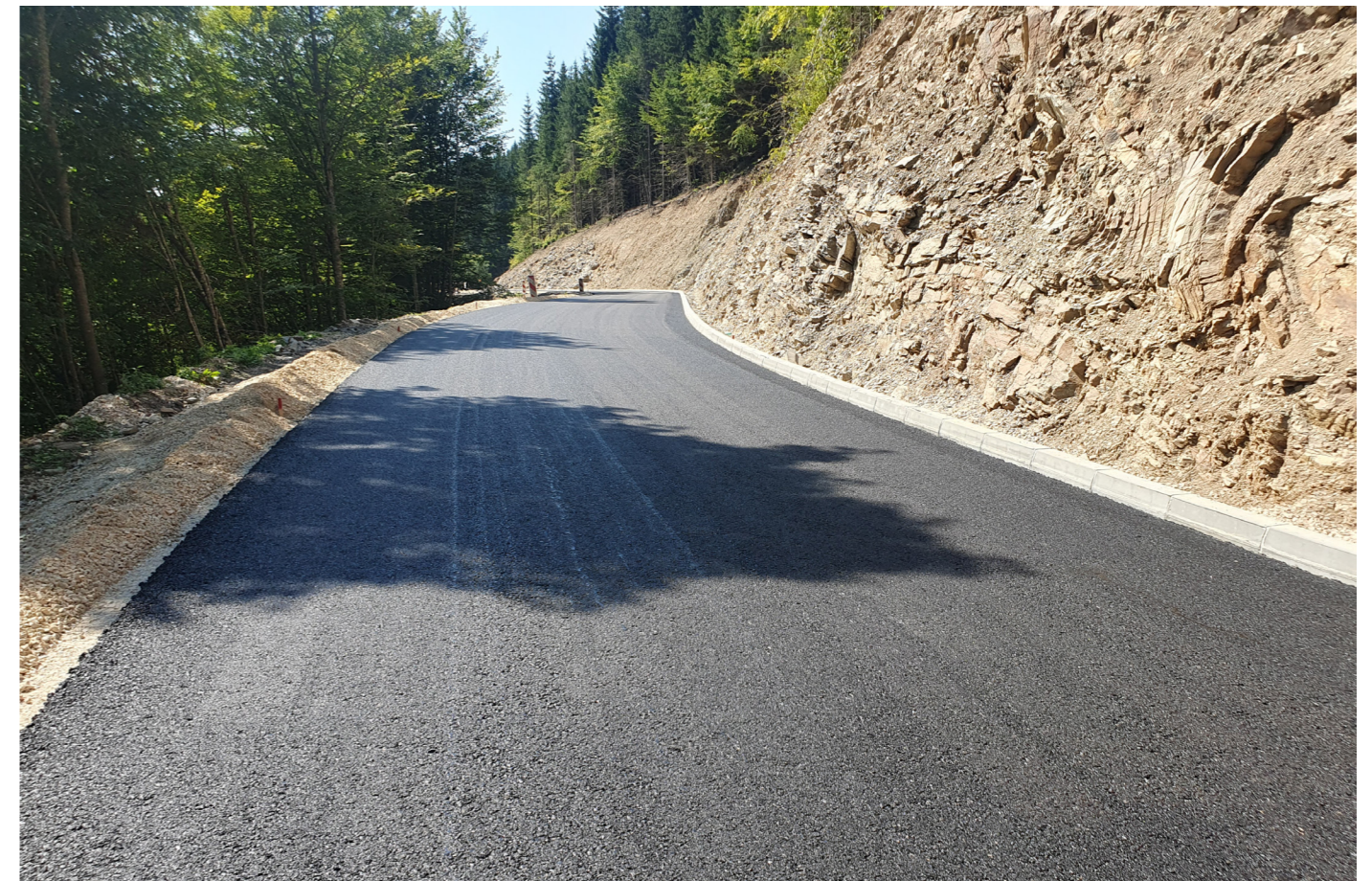
ПУТ БАРЕ - КАМЕНА ГОРА, ДЕОНИЦА БАРЕ - КОТЛИНЕ Д=4,70 км

4,7 км / ?? м ДУЖИНА / ШИРИНА 189 милиона ДИНАРА